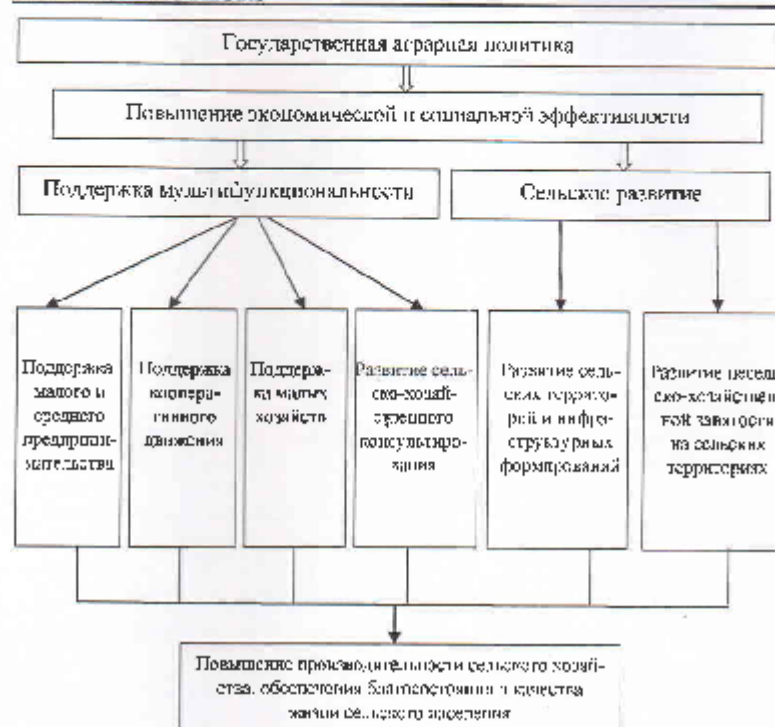
Рис. 1. Меры аграрной политики по повышению социально-экономической эффективности диверсификации предприятий